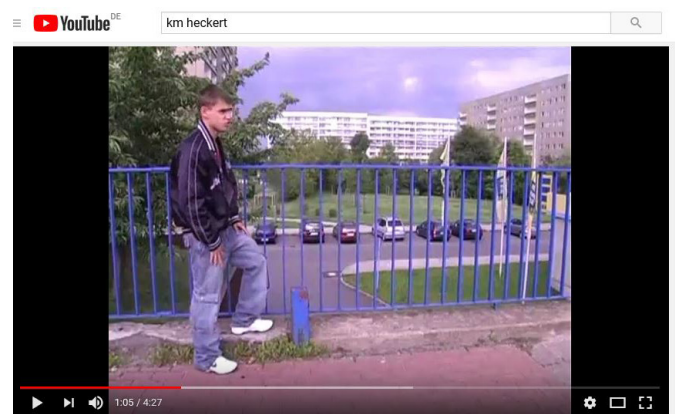
KM Heckert (Chemnitz)

Autos oder Einkaufsmöglichkeiten zu sehen wären, könnte man als ortsfremde Person den Jugendlichen ihre Schilderungen fast abkaufen.